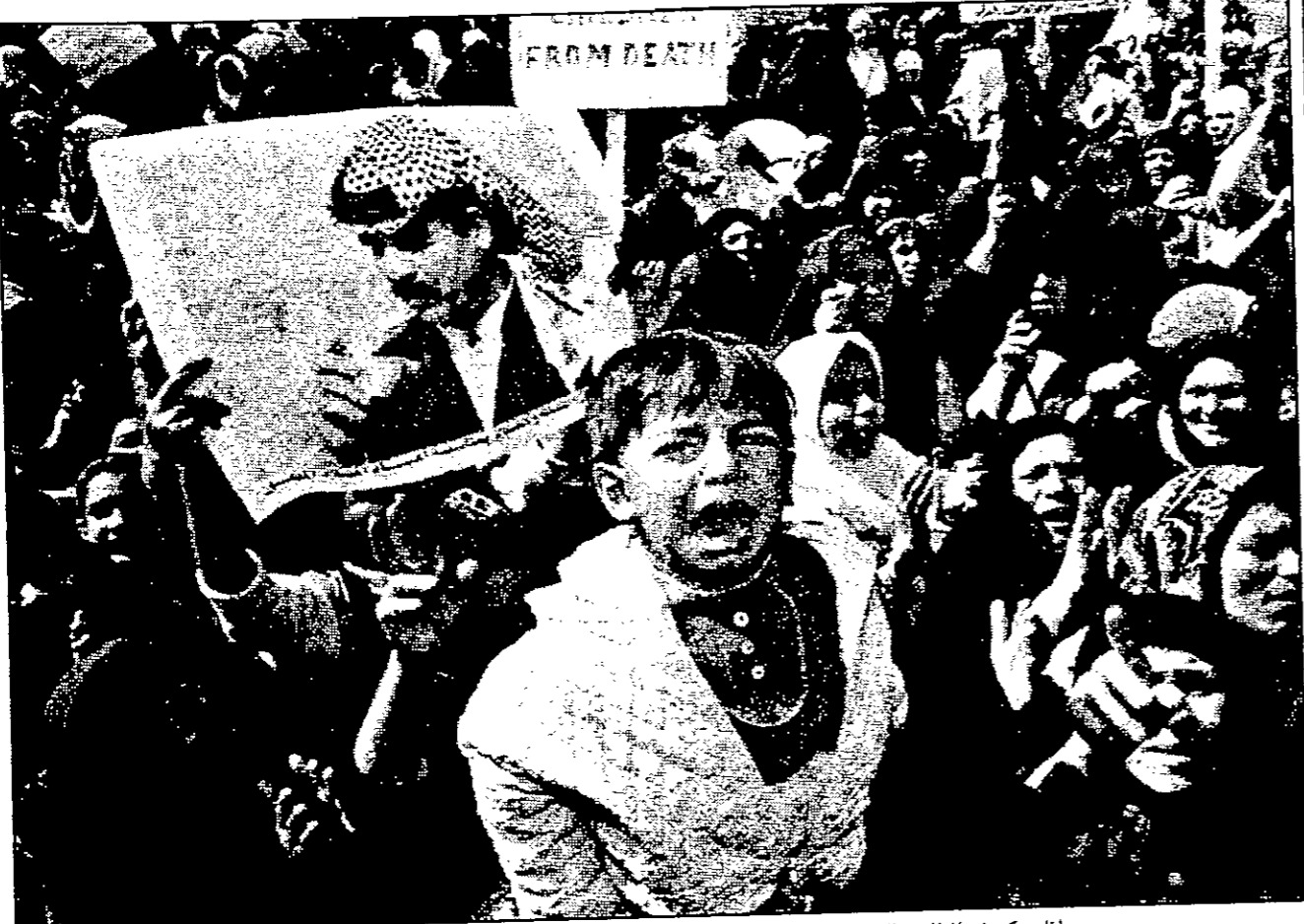
معلم يشرح لطلبة في الصف في المدرسة التي قامت بها مظاهرات العريقات في بغداد أمس للتعبير بالسياسة الأمريكية (رويتزر)

بغداد - اف ب: حث الملك الحسن الثاني ملك المغرب العربي على رفض سياسة المعايير المزدوجة في إشارة إلى موقف الولايات المتحدة إزاء العراق. ويعتقد الملك الحسن في كلمة القاها أمام السفراء العرب العرب في الرباط وخطبته وكلمته أثناء الاجتماعات الدولية التي أقيمت في الرباط في وقت سابق من الشهر الجاري، أن سياسات من الموقف العربي الواحد التي تتخذها بعض الدول من شأنها تقويض المصداقية العربية. وكان الملك الحسن قد شارك في اجتماعات منظمة المؤتمر الإسلامي في الرباط في وقت سابق من الشهر الجاري، وكان قد وقع على بيان نهائي يدعو إلى اتخاذ مواقف عربية واحدة إزاء العراق.